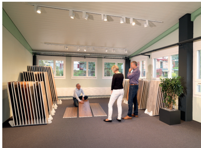
enia Showroom II

Die Entscheidung für einen Bodenbelag ist immer auch mit Emotionen verbunden. Umso wichtiger ist das Erlebbare look and feel der einzelnen Beläge, das enia nun im eigenen Showroom präsentiert: das sinnliche Gefühl, wenn die Hände über die unterschiedlichsten Parkettstrukturen gleiten. Das Erstaunen beim Betrachten der aussergewöhnlichen Oberflächen der LVT Beläge, die von ihrem Vorbild in der Natur kaum zu unterscheiden sind. Und die schier unendliche Farbauswahl, die mit den grossen Panels so richtig zur Wirkung kommt. enia's smartes Sortiment und die zahlreichen Design- und Oberflächeninnovationen begeistern die Kunden mit Qualität, Kreativität und der aussergewöhnlichen Vielfalt, die jetzt fassbar wird.