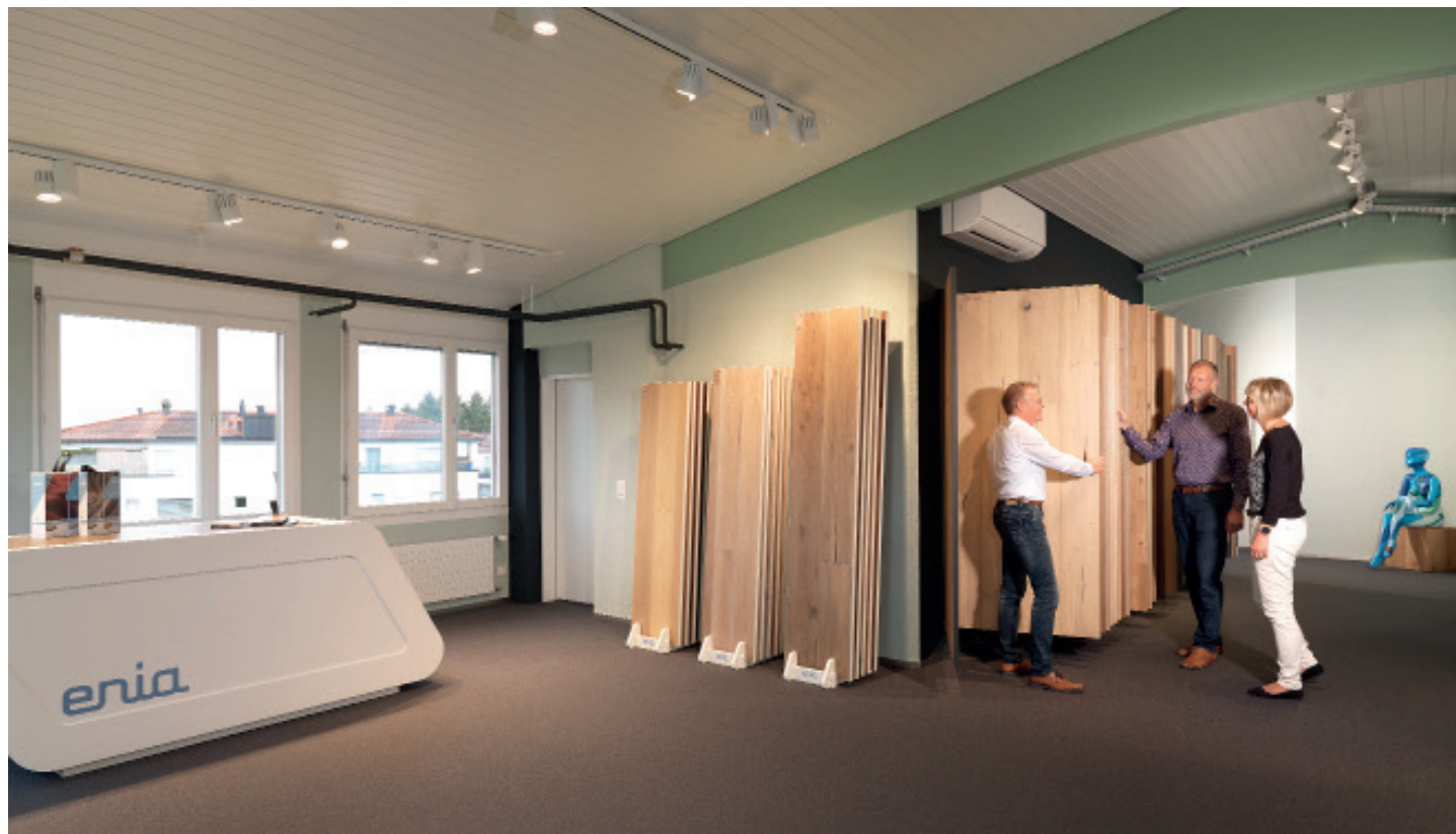
enia Showroom I

enia setzt mit immer neuen Belagskollektionen und innovativen Eigenentwicklungen seit einigen Jahren hohe Standards in der Bodenbelagsbranche. Ein Produktportfolio der Extraklasse und frische Impulse sorgen für kontinuierliches Wachstum im deutschsprachigen Markt. Der neue enia Showroom in Uster sorgt ab sofort für noch mehr Kundennähe und Erlebnischarakter.