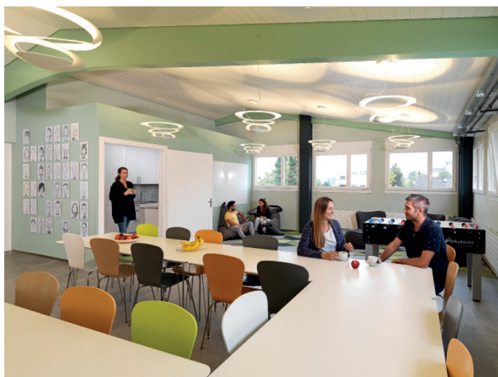
enia Kantine