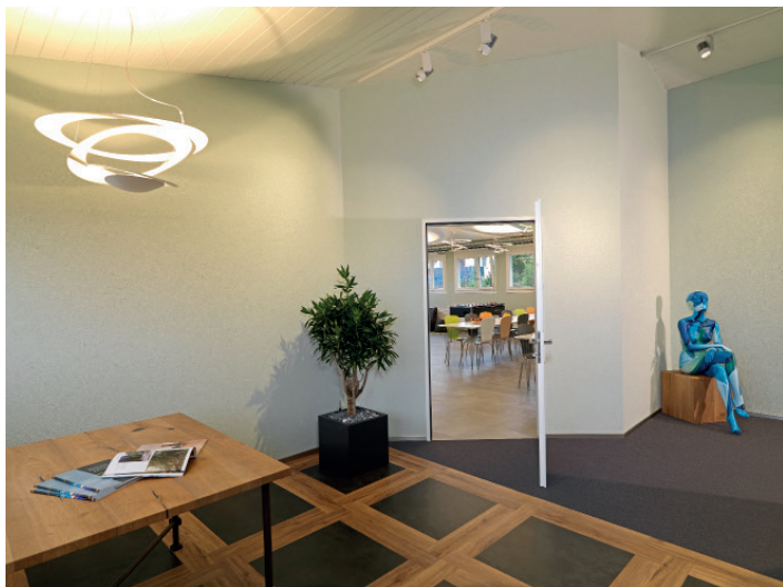
enia Eingang Showroom